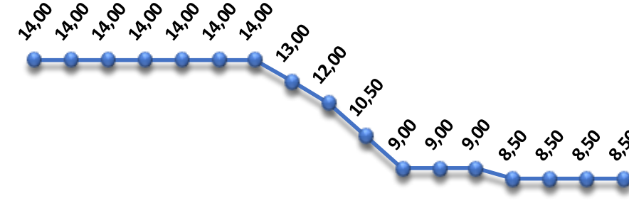
TCMB 1 Haftalık Repo Faizi

❖ Karar metninde Nisan ayına göre yapılan değişikliklere bakacak olursak, önceki metinde; depremin üretim, tüketim, istihdam ve beklentiler üzerindeki etkilerinin kapsamlı bir şekilde değerlendirilmekte olduğuna değinilirken, yeni metinde; "güncel veriler deprem bölgesinde ekonomik faaliyetin beklenenden hızlı toparlandığını göstermekte" ibaresi ile depremin etkilerine yönelik değerlendirme sürecinin sona erdiğine atıfta bulunulmaktadır.